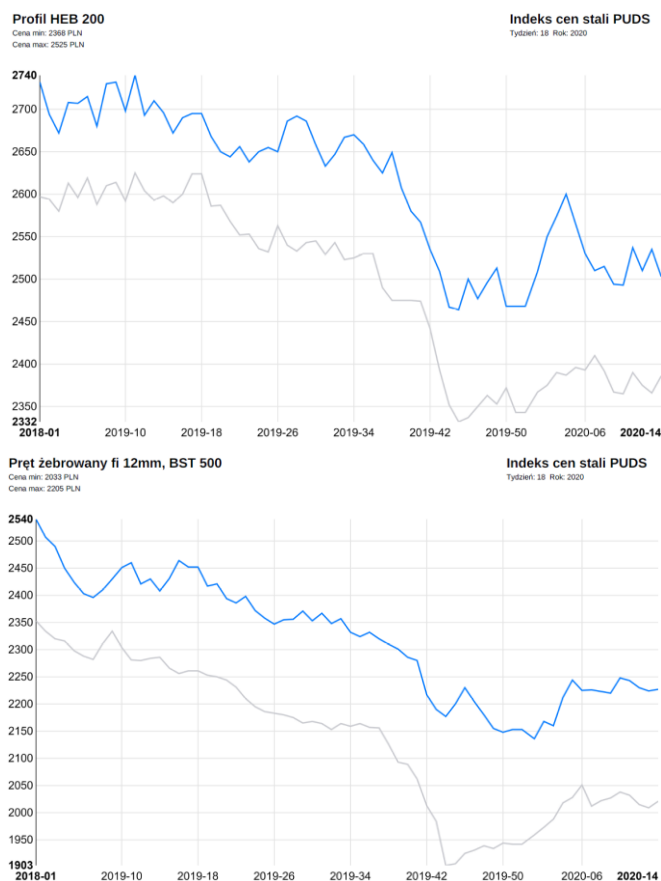
Rysunek 3 Ceny podstawowych wyrobów hutniczych na rynku polskim wg Polskiej Unii Dystrybutorów Stali

2019 rok przyniósł spadek cen stali. Po osiągnięciu minimum lokalnego pod koniec 2019 r., w I kwartale 2020 r. ceny wyrobów długich ustabilizowały się, a ceny wyrobów płaskich wzrosły (Rysunek 3). Wyniki Spółki wykazują dużą wrażliwość na zmiany cen wyrobów hutniczych.