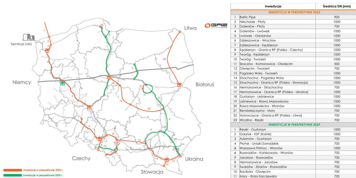
Rysunek 4 Inwestycje planowane przez OGP Gaz-System S.A. w latach 2020-2029

Wysoką rangę i wzrost tempa realizowanych w Polsce inwestycji w zakresie rozbudowy infrastruktury przesyłu gazu potwierdza również przyjęcie ustawy o zmianie ustawy o inwestycjach w zakresie terminalu regazyfikacyjnego skroplonego gazu ziemnego w Świnoujściu (Specustawa). Przewiduje ona uproszczenie i przyspieszenie procedur administracyjnych przy wymienionych w niej inwestycjach. Regulacjom była objęta budowa terminala LNG w Świnoujściu, kilkudziesięciu najważniejszych gazociągów przesyłowych (w tym Baltic Pipe), węzłów i tłoczni gazu, rozbudowa terminala LNG oraz budowa lub rozbudowa przez PGNiG podziemnych magazynów gazu: Wierzchowice, Mogilno, Kosakowo i Goleniów. Zmiana dotyczy objęcia Specustawą m.in. gazociągów dystrybucyjnych wysokiego ciśnienia o łącznej długości 577 km, których budowę planuje Polska Spółka Gazownictwa Sp. z o.o. (m.in: Konopki-Ełk-Mrągowo, Bytów-Chojnice, Dworzysko-Chojnice, Kolnik-Elbląg, Tulce-Nekla, Witkowo-Września, Łyszkowice-Koluszki-Brzeziny-Łódź, Kalisz-Sieradz-Meszczce oraz połączenie sieci dystrybucyjnej z przesyłową w Zambrowie, wraz z infrastrukturą niezbędną do ich obsługi). Dodatkowo, pod specustawę mają podlegać budowy przyłączy gazowych do Ciepłowni Kawęczyn i Elektrociepłowni Siekierki w Warszawie oraz budowa przyłączy lub połączeń z siecią przesyłową gazu przez wytwórców energii elektrycznej lub ciepła w gazowej jednostce wytwórczej lub jednostce kogeneracji.