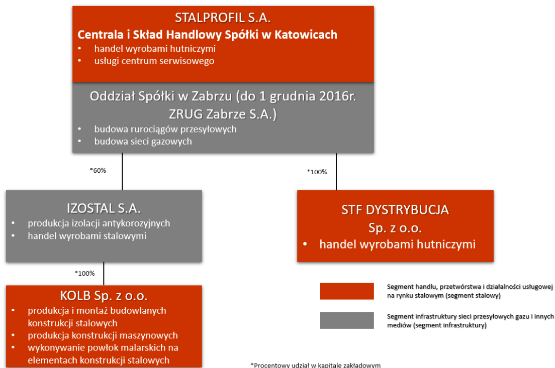
Rysunek 1 Struktura Grupy Kapitałowej STALPROFIL S.A.

Poziom zatrudnienia w Grupie Kapitałowej STALPROFIL S.A. na koniec I kw. 2020 r. oraz jego strukturę według charakteru wykonywanej pracy przedstawia Tabela nr 5. Stan zatrudnienia w Grupie na dzień 31 marca 2020 wynosił 548 osób (wzrost o 2,2% r/r). Wzrost nastąpił głównie w segmencie infrastruktury, który dysponuje dużym portfelem zamówień.