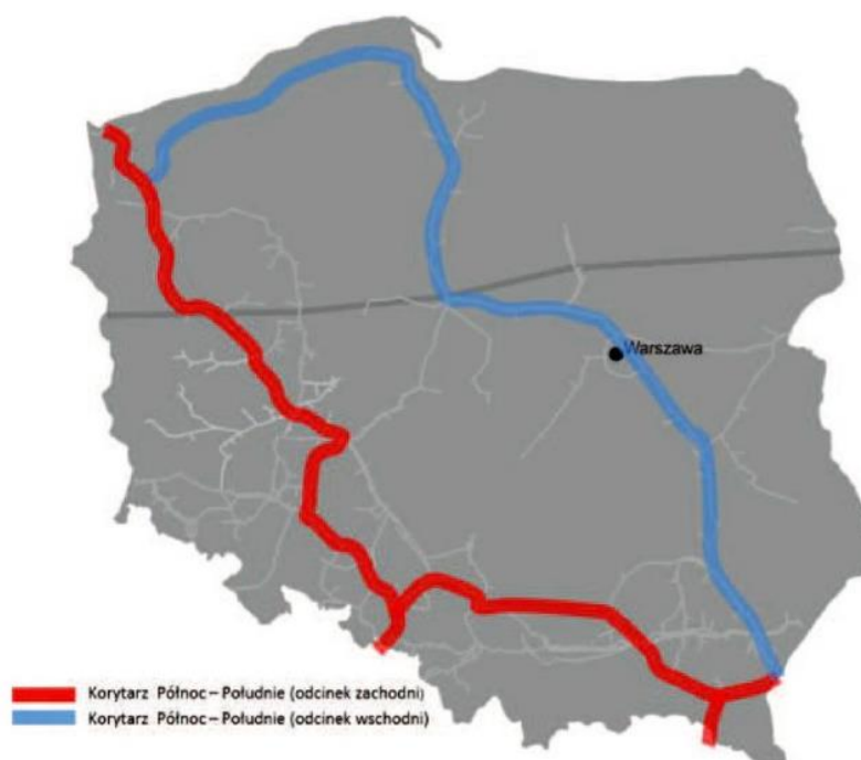
Rysunek 1 Planowany przebieg wschodniego i zachodniego korytarza rurociągów przesyłowych gazu ) 1